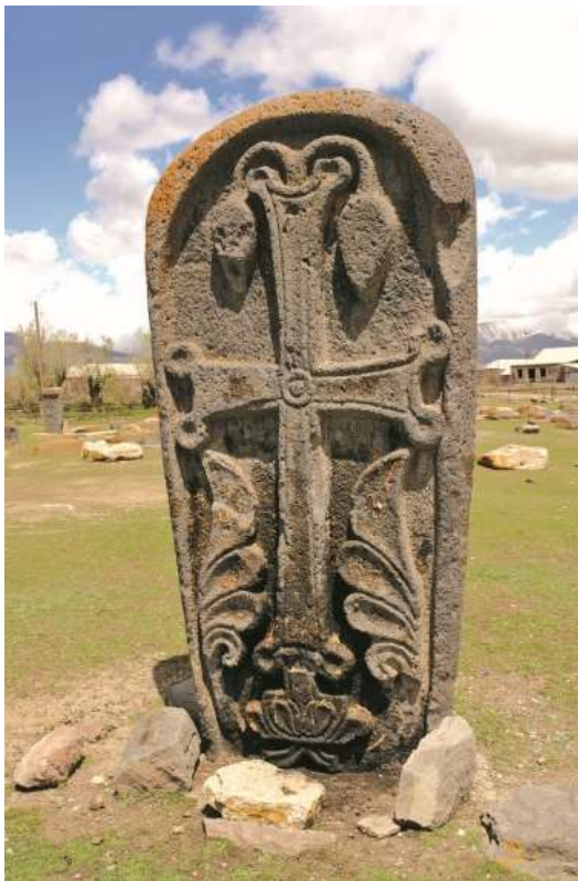
Նկ. 14. Մեծ Մասրիկ, 881 թ.