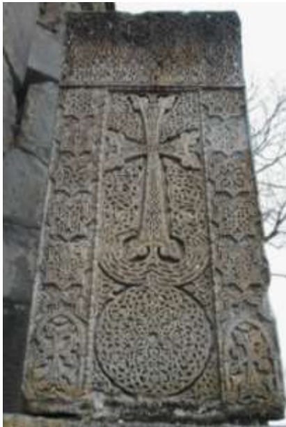
Նկ. 8. Հաղարծին, 13-րդ դար