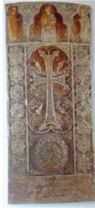
Նկ. 5. Նորավանք, Մովսիկ վարպետի խաչքար, 1308 թ., այժմ՝ Էջմիածնում