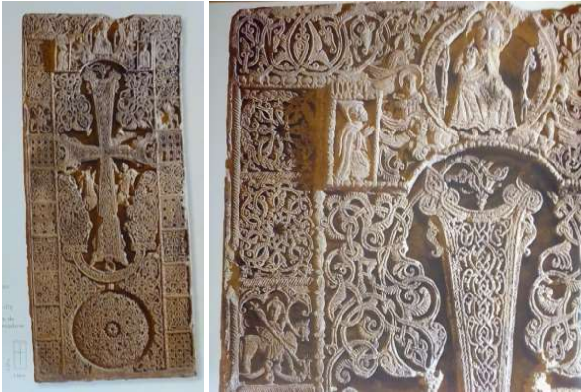
Նկ. 18. Գտչավանք, 1246 թ., այժմ՝ Էջմիածնում