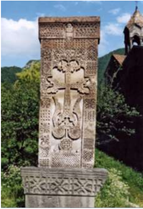
Նկ. 4. Հաղպատ, Ուբանաց երկրորդ խաչքար, 1220 թ.