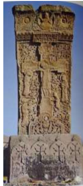
Նկ. 9. Դսեղի Ամենափրկիչ, 1281 թ.