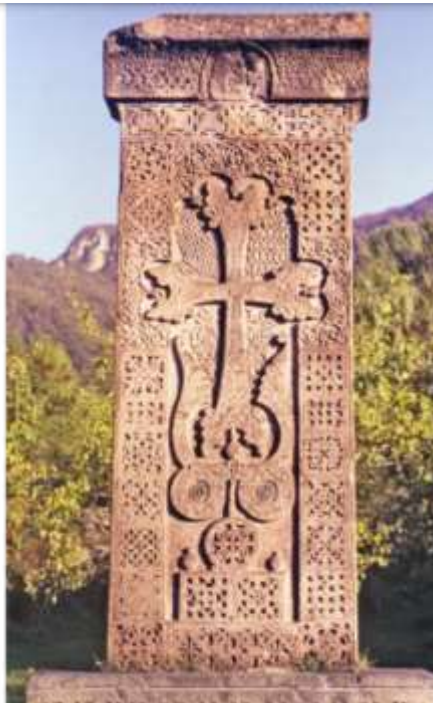
Նկ. 3. Հադլատ, Ուբանաց առաջին խաչքար, 1211 թ.