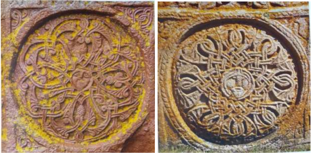
Նկ. 16. Վարդյակներ՝ Աղամի գլուխը մեջտեղում