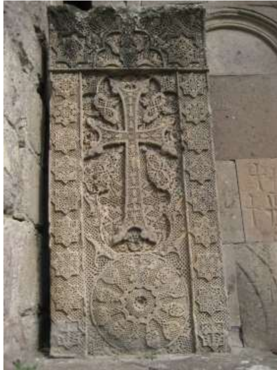
Նկ. 11. Գոշավանք, Պողոս վարպետի խաչքար, 1291 թ.