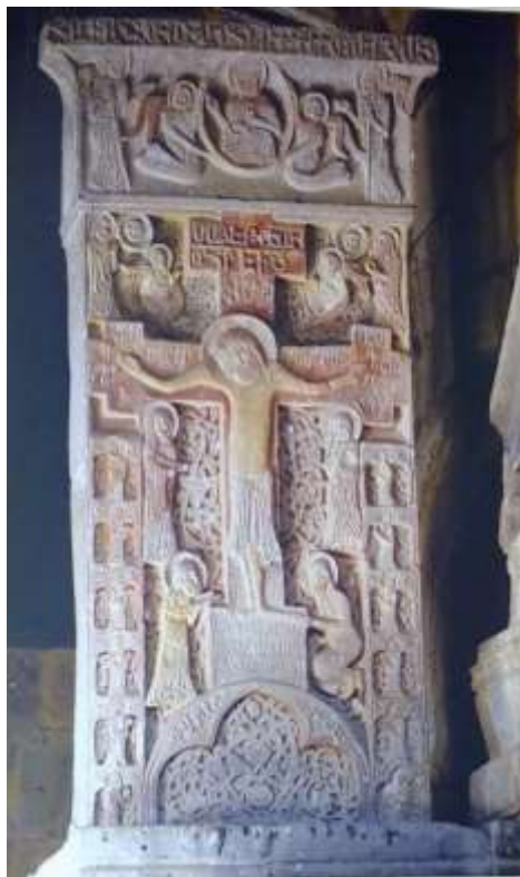
Նկ. 17. Հաղպատի Ամենափրկիչ, 1273 թ.