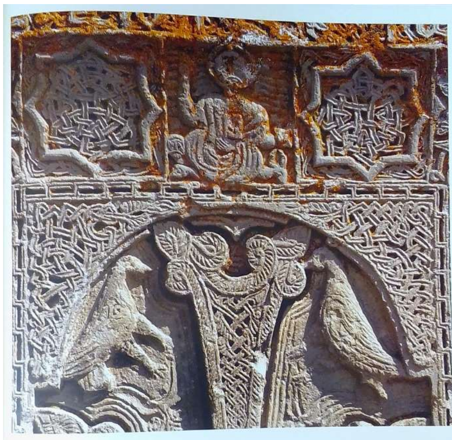
Նկ. 10. Գավառ, խաչքարի քիվ