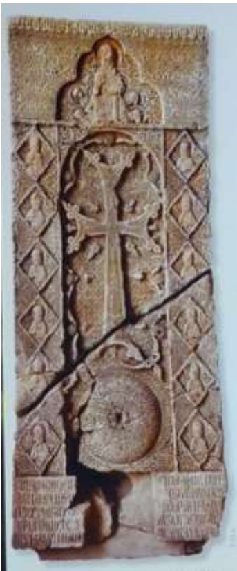
Նկ. 6. Նորավանք, Մովսիկ վարպետի խաչքար, 14-րդ դարի սկիզբ, այժմ՝ Եղեգնաձորի թանգարանում