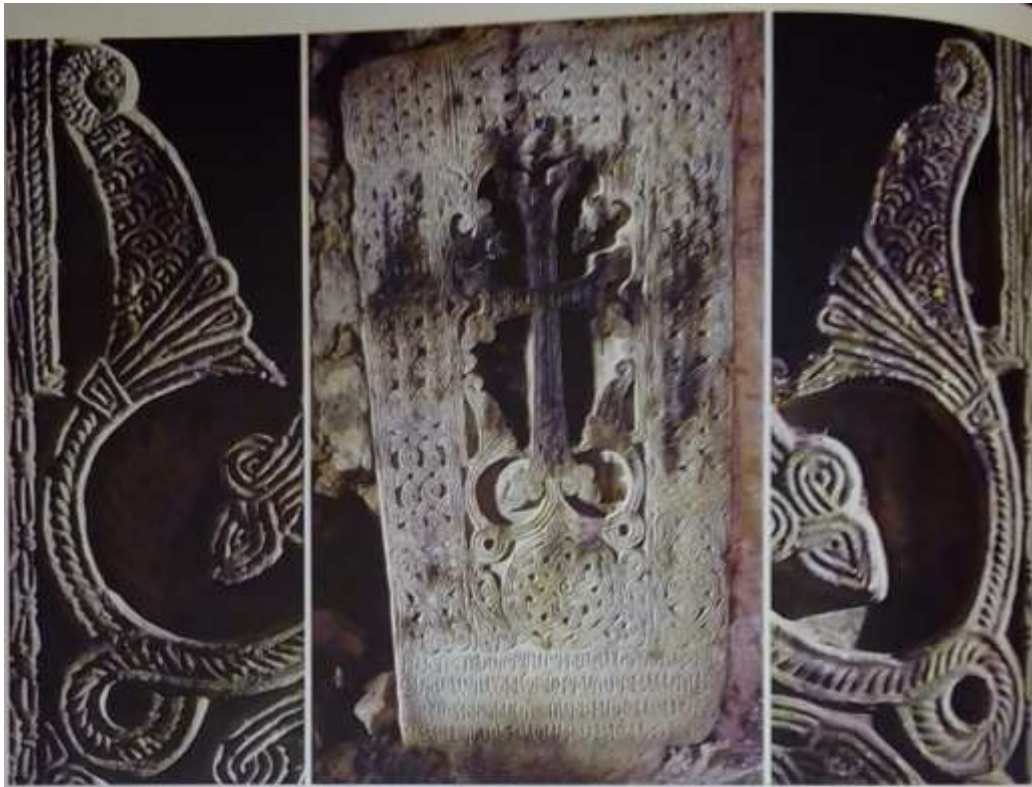
Նկ. 13. Հակոբավանք, 1223 թ.