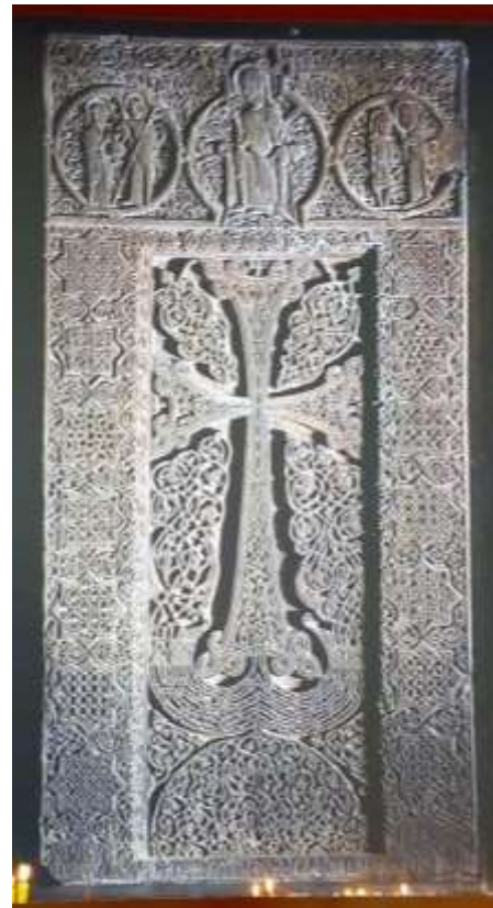
Նկ. 7. Գեղարդավանք, 1213 թ.