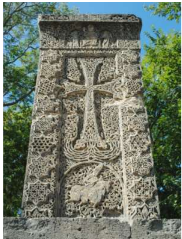
Նկ. 15. Իմիրզեկի խաչքար, 1233 թ., այժմ՝ Էջմիածնում