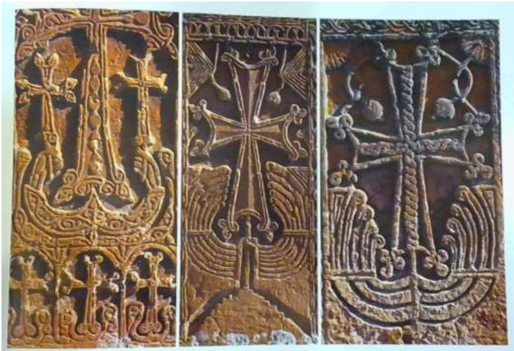
Նկ. 12. Առիևի գերեզմանատուն, խաչքարեր