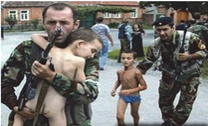
Նկ. 2 2004 թ. ահաբեկչությունը Բեսլանում (Հս. Կովկաս):

Ահաբեկչության հիմնախնդիրն ուսումնասիրող մասնագետներն առանձնացնում են ահաբեկչության դեմ պայքարի երկու հնարավոր ստրատեգիա՝ «առաջադիմական» և «պահպանողական»: «Պահպանողական» ռազմավարություն է համարվում ահաբեկիչների պահանջներին մասնակի զիջման գնալը, փրկագին վճարելը, տարածքային և բարոյական զիջումները (օրինակ՝ ընդունել արժեքները, ահաբեկիչների առաջնորդին ճանաչել որպես բանակցող կողմ և այլն): Այդպիսի դիրքորոշմանը մինչև վերջին ժամանակներս հետևում էին Ռուսաստանի Դաշնությունում: