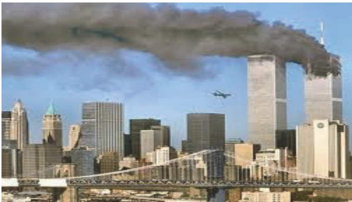
Նկ. 1 2001 թ. ահաբեկչությունը Նյու Յորքում:

Որպես 2001 թ. սեպտեմբերին «Ալ Բաիդա» իսլամական ահաբեկչական կազմակերպության կողմից (ղեկավար, միջազգային թիվ 1 ահաբեկիչ Ուսամա Բեն Լադեն) Նյու Յորքի և Վաշինգտոնի վրա կազմակերպված ահաբեկչությունների հատուցման ակտ ԱՄՆ-ը Աֆղանստանի տարածքում իրականացրեց ոմբակոծություններ, որտեղ գտնվում էին «Ալ Բաիդայի» գրոհայինների գլխավոր բազաները: